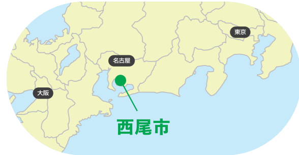
名古屋から約50分、三河湾に面した風光明媚なまちです。